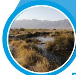
Poza El Garabatal