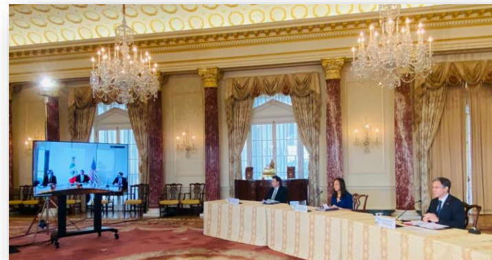
Videollamada entre los secretarios Blinken y Ebrard