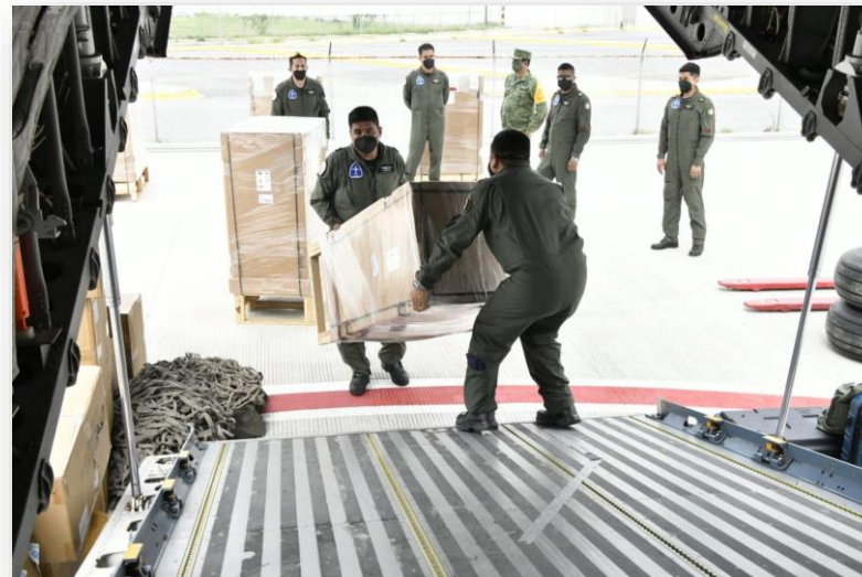
Envío de ventiladores mecánicos fabricados en México