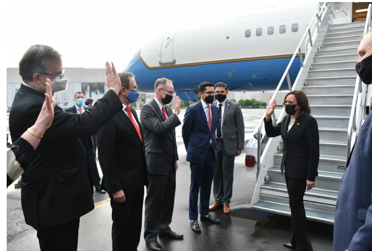
Visita oficial a México de la vicepresidenta Kamala Harris, 8 de junio de 2021.