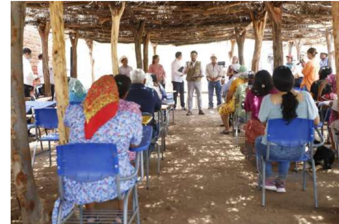
Encuentro con la comunidad de Mesa Colorada