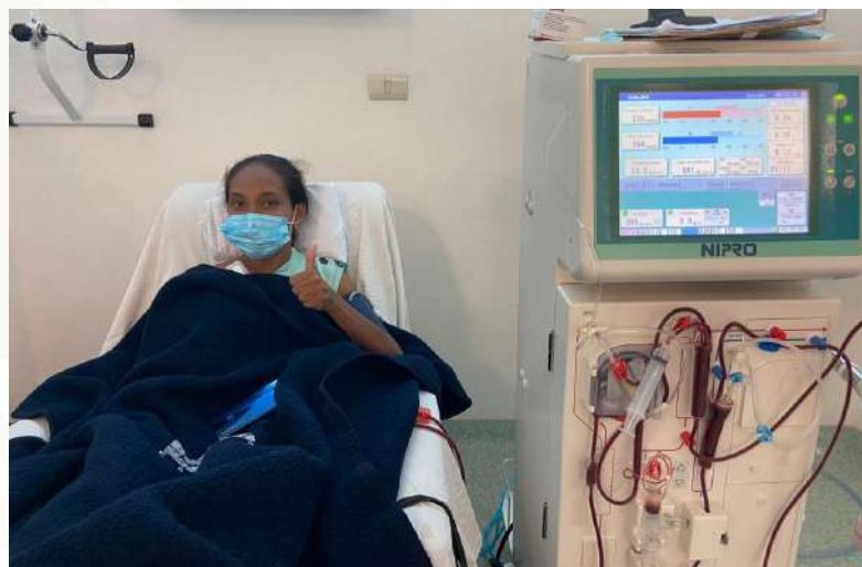
Centro Estatal de Hemodiálisis