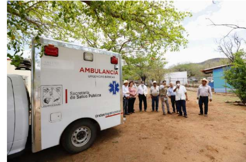
Centro de Salud de Mesa Colorada