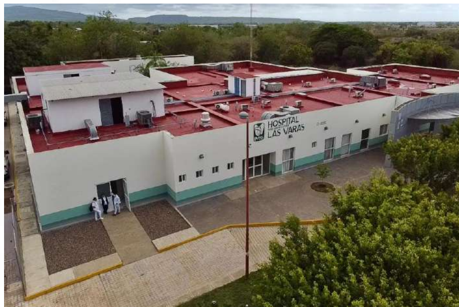
Hospital de Las Varas, Nayarit