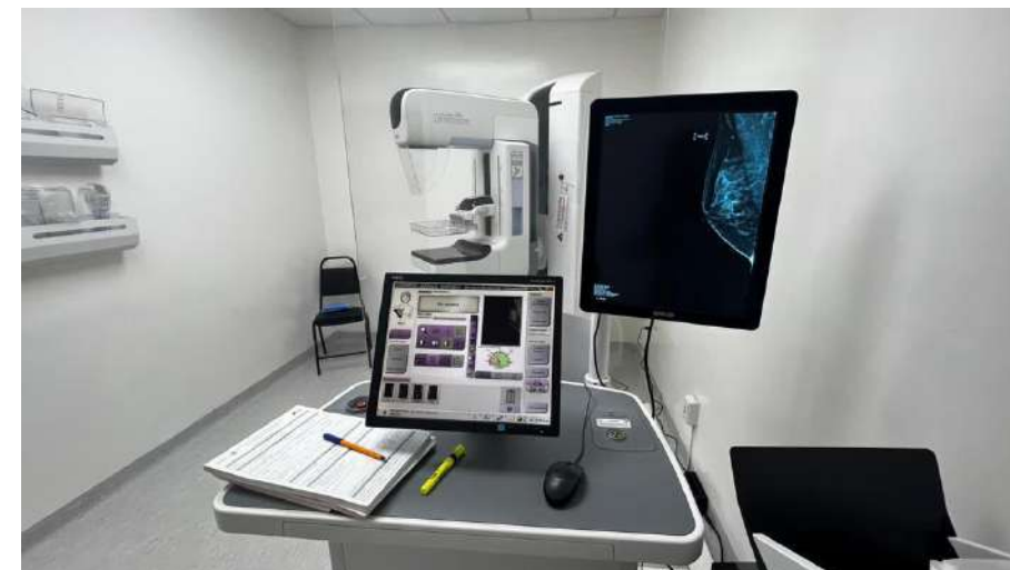
Mastógrafo en el Hospital de Manzanillo