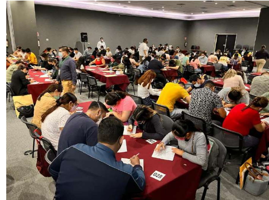
Proceso de regularización en Colima