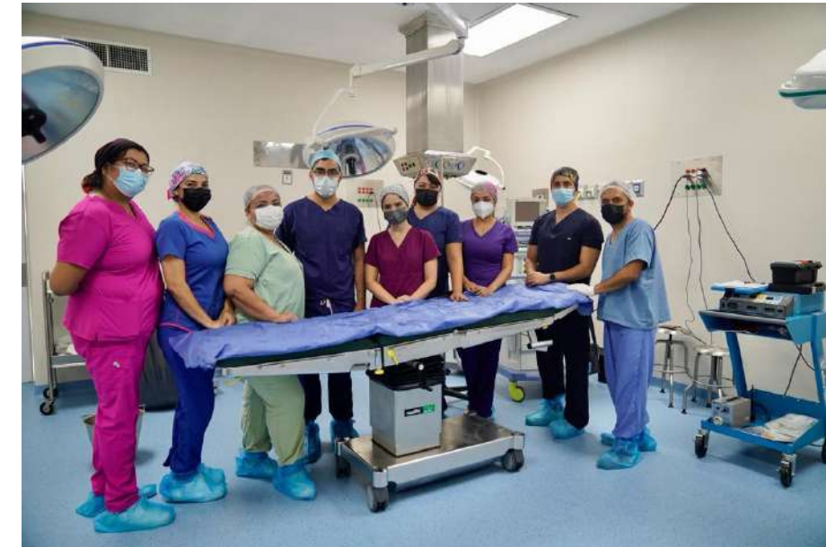
Hospital de Las Varas, Nayarit