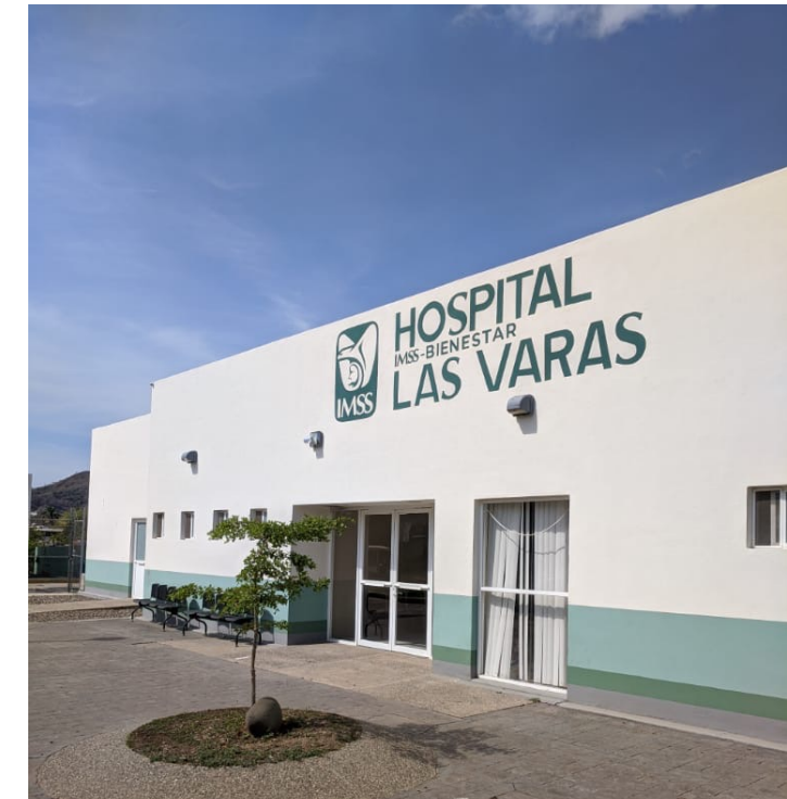
Hospital de Las Varas, Nayarit