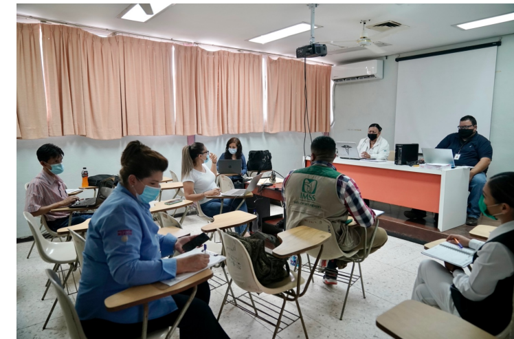
Capacitación de personal Hospital de Ixtlahuacán