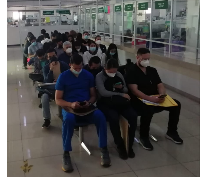
Mesa de acreditación en Ciudad de México Sur

La contratación de la primera ronda de especialistas quedará concluida el 1 de julio