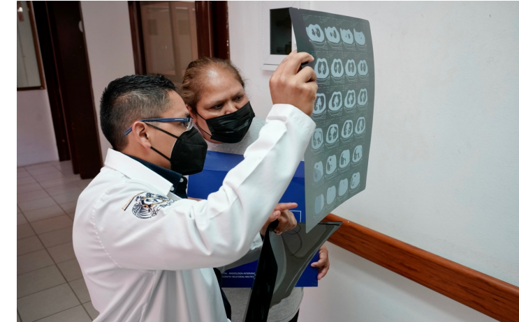
Servicios médicos del Hospital de San Francisco Nayarit