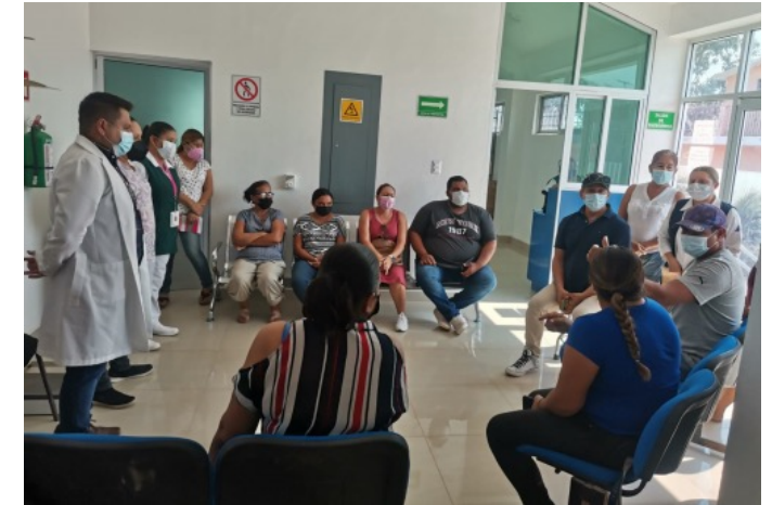
Reunión con líderes de la comunidad Llano de la Cruz municipio de Acaponeta

Jardines de plantas medicinales establecidos 32