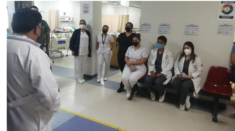
Encuentro con trabajadores del Hospital de San Luis Río Colorado