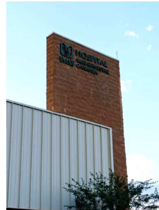
Hospital de Cananea