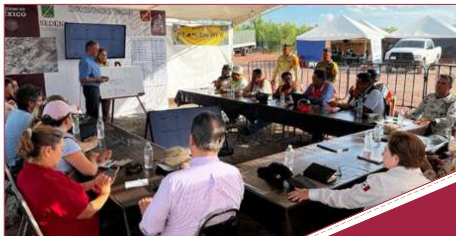
Reunión con EUA