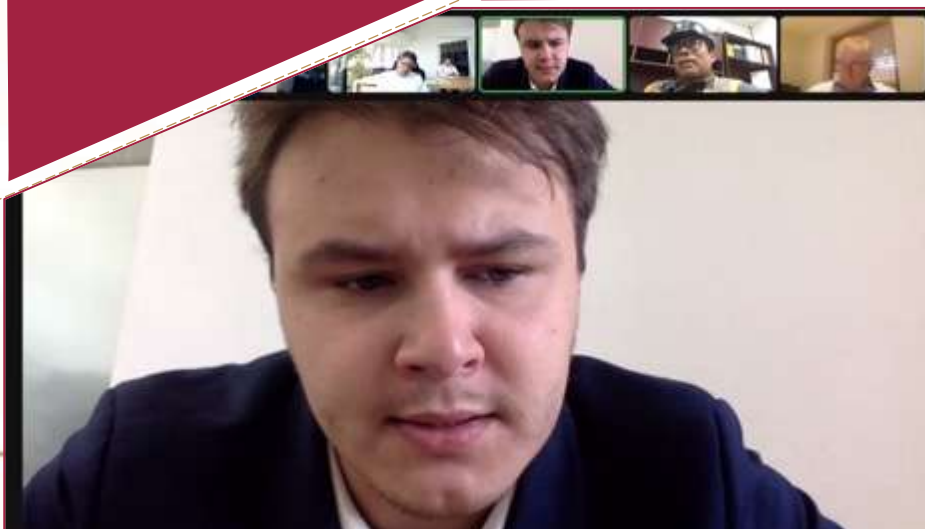
Reunión con Alemania