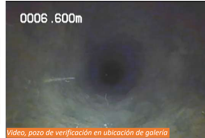
Video, pozo de verificación en ubicación de galería

CNPC COORDINACIÓN NACIONAL DE PROTECCIÓN CIVIL