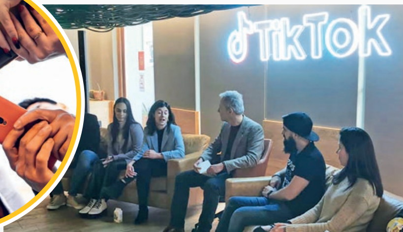
Otros usos de la red social, como Pymes.