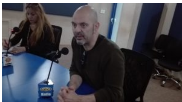
Daniel Estulin, en Voces del Periodista Radio

CIUDAD DE MÉXICO, 18 de octubre de 2017.- El mundo es testigo de la lucha sin cuartel entre dos grupos de poder supranacional: por un lado, el nacionalista, que representa el actual presidente de los Estados Unidos, Donald Trump , y el globalista, cuya figura más visible hoy es Hillary Clinton , indicó el investigador y periodista Daniel Estulin .